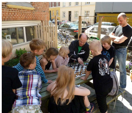
Gennemgang af fif og gode tricks til sommerskak i AS 04 på Nørrebro.